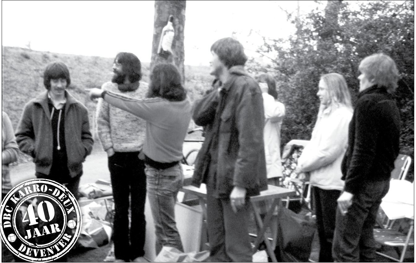
■ Hippieharen, tevens de wedstrijdkamer.

1 Augustus 2020 is het zover. Karro-Deux bestaat 40 jaar. We wilden dat jubileum groots vieren. En dat willen we nog steeds, maar corona heeft virus in de plannen gegooid. De commissie die de organisatie voor dat feest op zich heeft genomen heeft helaas moeten besluiten tot tijdelijke afgelasting. Maar we willen nadrukkelijk stellen dat in dit geval uitstel géén afstel gaat worden. Komend jaar zullen we, zodra dat mogelijk is, het jubileum 40+ gaan vieren.