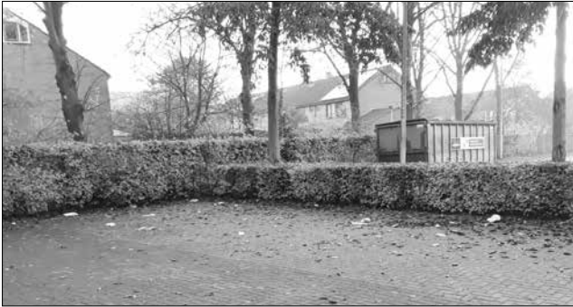
■ De parkeerplaats na intensief gebruik.

Het is ongelooflijk hoe snel de natuur de door mensen ingerichte terreinen en bouwwerken heroverst. We zagen dat aan ons jeu de boules veld. Op het moment dat ik een keer in april ging kijken lag alles er verlaten bij. Niets werd verstoord door banden of voetsporen. Alleen de parkeerplaats was besmeurd met diverse zaken, achtergelaten door eters, snuivers, lachgassers en zelfs door intensief met elkaar omgaande (al dan niet tijdelijke) geliefden!