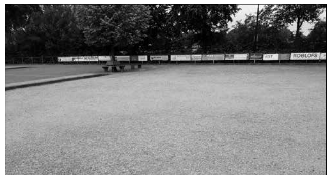
■ Het veld is weer zonder onkruid.