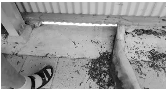
■ Het stormgat in de hal.