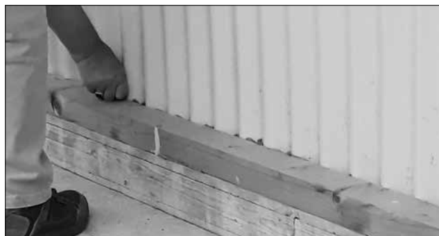
■ Eerste gat is dicht en aanbrengen van de worstjes.

bladsnippers van de bomen en zelfs stukjes van de isolatie. In paniek werd toen gedacht aan steenmarters. Het moesten er wel een stuk of 20 zijn... Anderen dachten dat de hele isolatie van de hal omlaag gezakt was. Geen wonder dus dat de verwarming de hal niet op temperatuur kreeg.